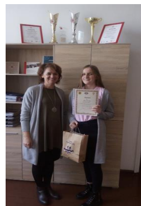
Uczestnicy konkursu „Więcej wiem -żyję bez ryzyka”