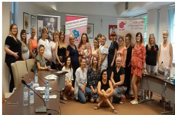
Spotkania w Starostwie (maj i sierpień)