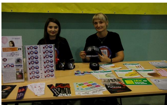
Turniej Kół gospodyń Wiejskich w ZSP nr 2

Zainteresowani mogli otrzymać ulotki z wyżej wymienionych tematów. Z problemem tym od kilku lat zderzają się polskie samorządy i rodziny dlatego priorytetowe staje się podejmowanie działań w jak najszerszym zakresie.