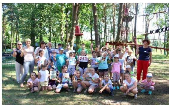
Półkolonie PCAS I i II turnus.