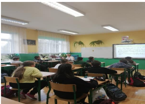
Szkoła Podstawowa w Łaznowie