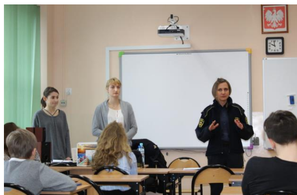
Szkoła Podstawowa nr 3