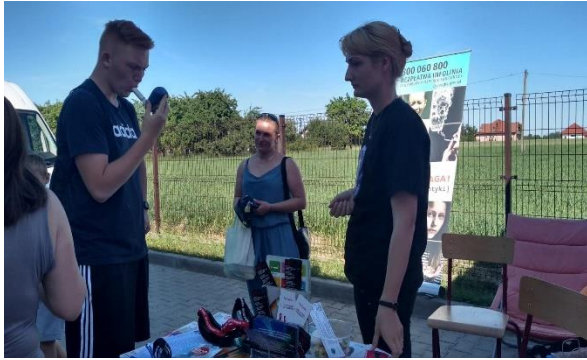
Festyn rodzinny w Wiadernie