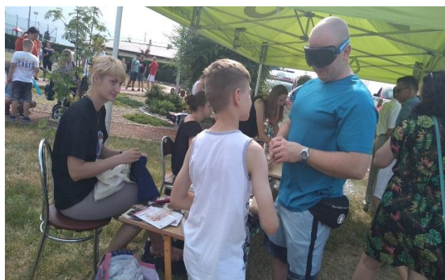
Festyn rodzinny w Chorzęcinie