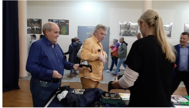
Dzień Seniora w ZSP nr 1