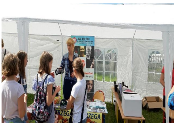
Festyn rodzinny w Cekanowie