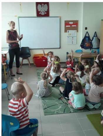
Szkoła Podstawowa w Chorzęcinie

Pracownik Oświaty Zdrowotnej, podczas wycieczki zimowego i letniego, organizował spotkania dotyczące bezpiecznych zachowań, profilaktyki chorób zakaźnych oraz prowadził działania związane z profilaktyką uzależnień. Odbywały się pogadanki, prezentacje multimedialne, projekcje filmów, konkursy, które skierowane były do uczestników wycieczek.