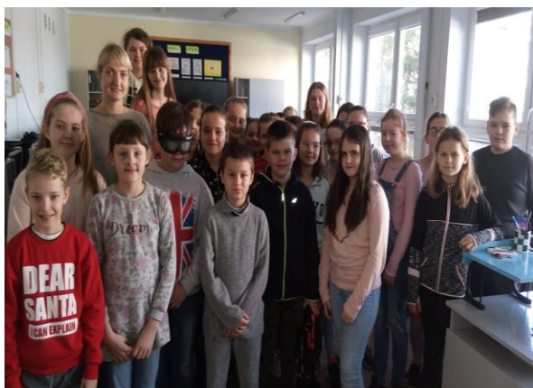
Szkoła Podstawowa w Budziszewicach