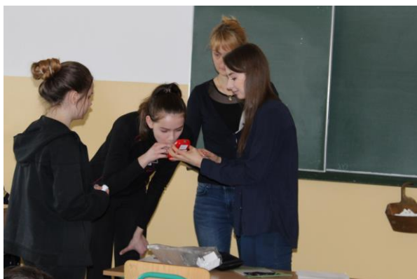
Zespół Szkolno-Przedszkolny nr 8