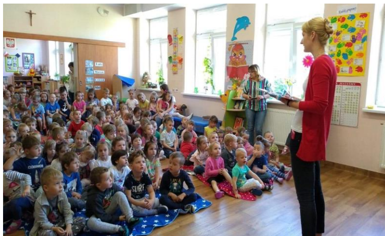
Przedszkole w Niewiadowie