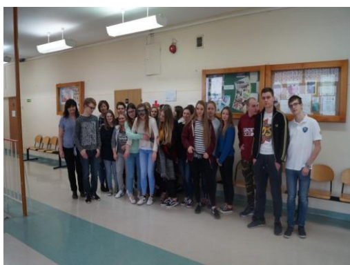
Uczniowie Zespołu Szkół Ponadgimnazjalnych nr 8 w Tomaszowie Mazowieckim

„Dopalaczom mówimy STOP – wybieramy zdrowie” - jest to Wojewódzka Kampania Edukacyjna Państwowego Wojewódzkiego Inspektora Sanitarnego w Łodzi. Celem Kampanii jest obniżenie wśród uczniów tendencji do podejmowania ryzykownych zachowań generowanych przez grupę rówieśniczą, prowadzących do sięgania po różnego rodzaju substancje psychoaktywne. W roku szkolnym 2017/18 w kampanii udział wzięło 13 szkół gimnazjalnych. Podczas realizacji koordynatorzy korzystali z materiałów otrzymanych od organizatorów (plakaty, ulotki, prezentacje, filmy). Dodatkowo wśród uczniów szkół gimnazjalnych były podejmowane dodatkowe działania.