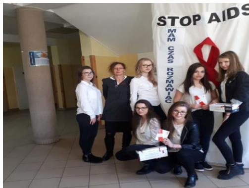
Uczniowie Zespołu Szkół Ponadgimnazjalnych nr 2

Państwowy Powiatowy Inspektor Sanitarny realizuje Krajowy Program Zwalczania AIDS i Zapobiegania Zakażeniom HIV . „Mam czas rozmawiać” to nowa Kampania skierowana do rodzin wielopokoleniowych, których może dotyczyć zakażenie HIV. Przekazano materiały edukacyjne do szkół ponadgimnazjalnych oraz placówek leczniczych.