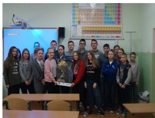
Uczniowie Publicznej Szkoły Podstawowej w Brzustowie

Przeprowadzono 32 wizytacje z ogólnopolskich programów profilaktycznych oraz kampanii realizowanych przez placówki oświatowe na terenie powiatu tomaszowskiego