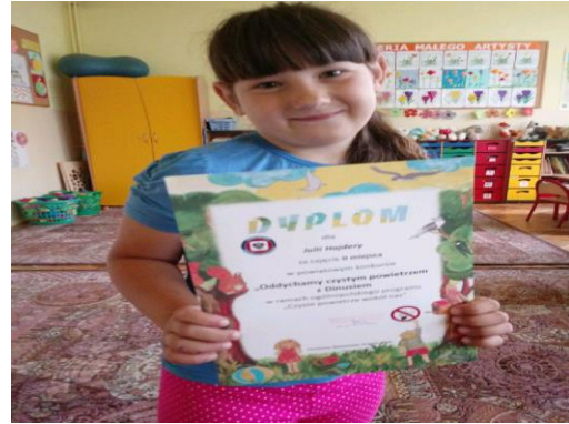
Dzieci ze Szkoły Podstawowej nr 7 w Tomaszowie Mazowieckim