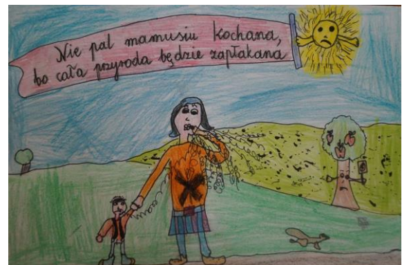
Prace plastyczne wykonane przez uczestników konkursu

wobec problemu palenia tytoniu i przyczynić się do lepszych wyników w leczeniu uzależnienia od nikotyny. W roku szkolnym 2017/2018 program został zrealizowany przez 17 placówki szkolne. Z relacji koordynatorów wynika, że dzieci chętnie uczestniczą w realizacji programu, potrafią asertywnie reagować, gdy ktoś w ich otoczeniu pali papierosy. Koordynatorzy na podstawie otrzymanych materiałów (poradnik, malowanki, ulotki, materiały dźwiękowe) realizowali program, który oceniali pod względem merytorycznym wysoko. Dodatkową inicjatywą była możliwość udziału w konkursie pod hasłem „ Oddychamy czystym powietrzem – dbamy o środowisko ”. Polegał on na wykonaniu plakatu antytytoniowego wykorzystując surowce wtórne. Praca przedstawiała zagrożenia związane z czynnym i biernym paleniem promując otoczenie wolne od dymu tytoniowego. Patronat nad konkursem objęła Eneris Surowce S. A. Prace nagrodzone i wyróżnione można było oglądać w Centrum Kultury „Tkacz” w Tomaszowie Mazowieckim.