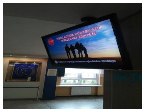
Spot dot. profilaktyki antidopalaczowej wyświetlany w Szkole Podstawowej nr 10 w Tomaszowie Mazowieckim