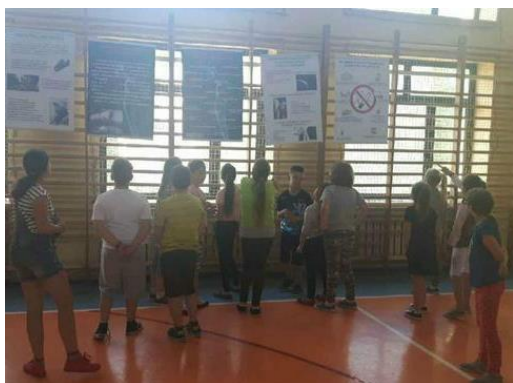
Uczniowie Szkoły Podstawowej Komorowie

Działania w ramach profilaktyki antytytoniowej były również prowadzone wśród uczniów szkół powiatu. Uczestnicy działań mieli okazję zapoznać się z zagrożeniami wynikającymi z palenia tytoniu poprzez obejrzenie wystawki antytytoniowej "Całą prawdą o papierosie" . Zwiedzający wystawę mogli poszerzyć swoją wiedzę na temat składu chemicznego papierosów, działania nikotyny na organizm, szkodliwości wynikającej z czynnego i biernego palenia, chorób odtytoniowych oraz ekonomicznych skutków nałogu i korzyści wynikających z jego zwalczania. Na banerach zaprezentowano również historię papierosa oraz przepisy prawne regulujące palenie. Przekazane informacje miały za cel zniechęcić młodzież do sięgania po papierosy.