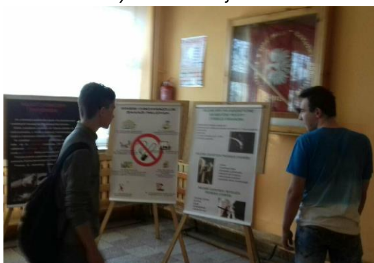
Młodzież z Gimnazjum z Popielaw