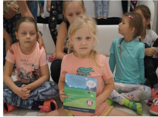
Uczestnicy letniego wypoczynku wraz z rozdanyimi materiałami.