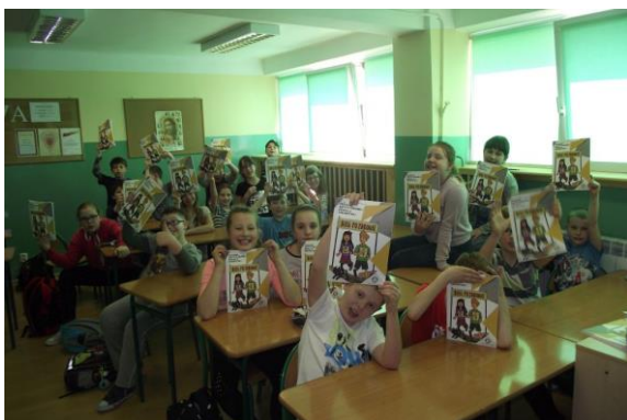
Uczniowie ze Szkoły Podstawowej w Rokicinach.