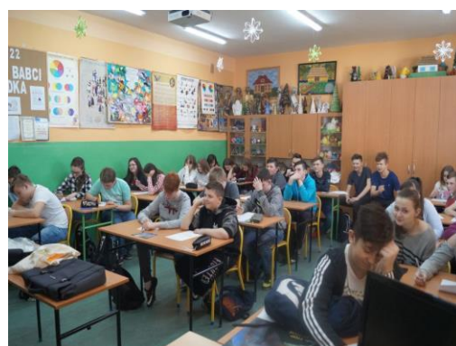
Rozwiązywanie krzyżówek przez uczniów Szkół Podstawowych

W przychodniach "PROMYK" Śmietanka oraz Centrum Medycznym "KA-MED w Tomaszowie Mazowieckim, odbyła się realizacja celów ŚDZ 2018. Utworzony został punkt informacyjno-konsultacyjny wspólnie z Pracownikiem Nadzoru Epidemiologii. W interwencji udział wzięli pacjenci przychodni. Zainteresowani otrzymywali materiały edukacyjne.