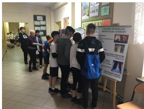
Dzieci ze Szkoły Podstawowej nr 7