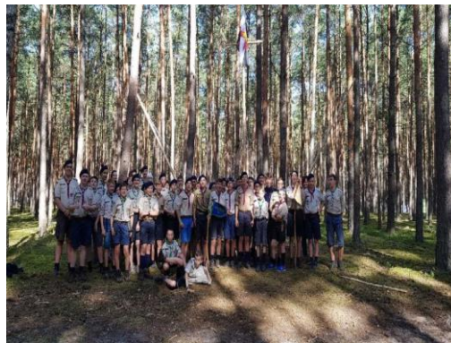
Harcerze ze Stowarzyszenia Harcerstwa Katolickiego "Zawisza", którzy stacjonują w lasach spalskich.