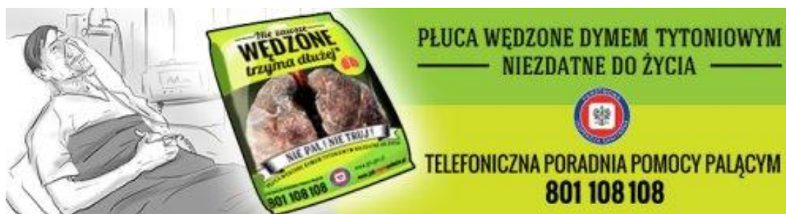
Kampania informacyjna oraz rozdawnictwo materiałów.