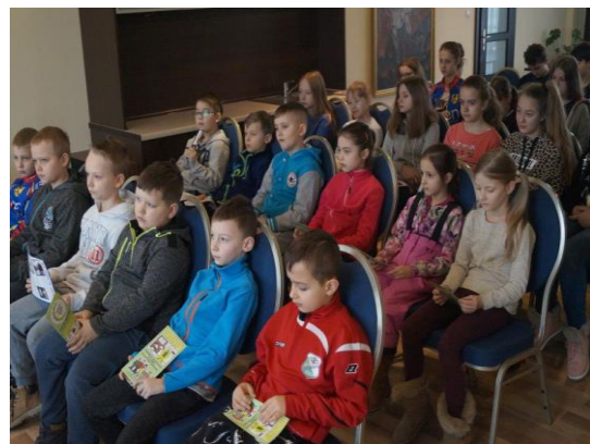
Uczestnicy zimowego wypoczynku podczas spotkania informacyjno-profilaktycznego