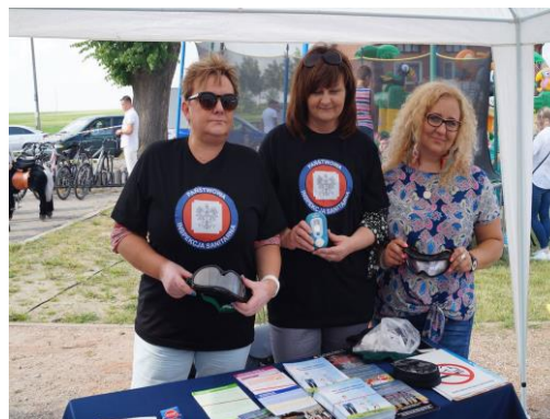
Uczestnicy pikniku wraz z pracownikami PSSE w Tomaszowie Maz.