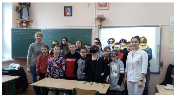
Spotkania profilaktyczne w szkołach.