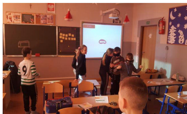
Uczestnicy działań bezpiecznych ferii