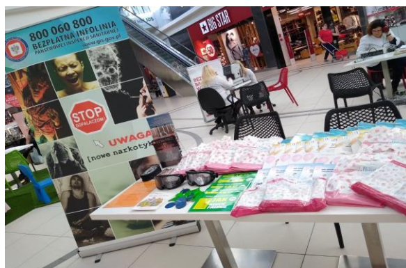
„Dni Zdrowia” w Tomaszowskiej Galerii